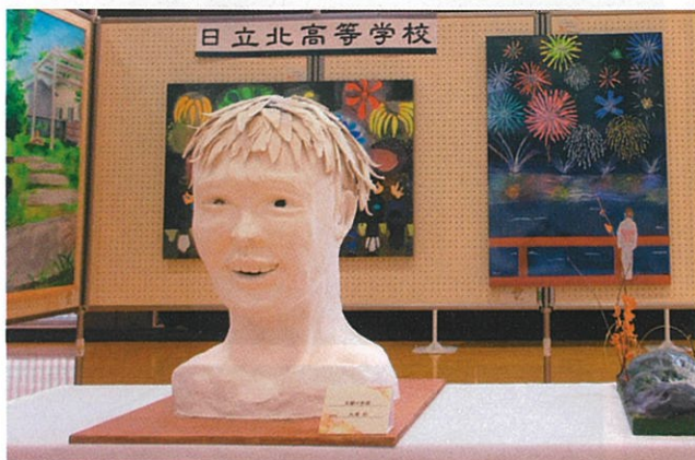
日立北高校生の作品