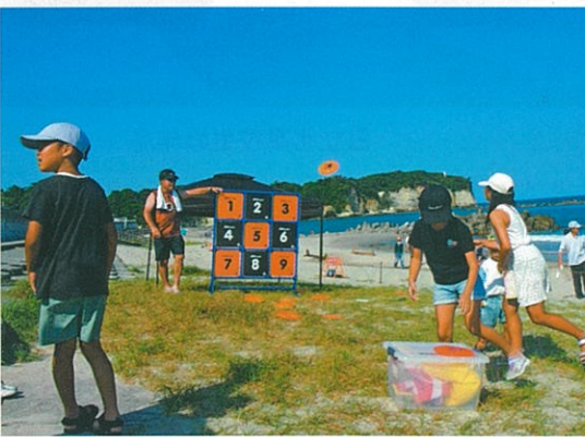
ゲーム《フリスビー》