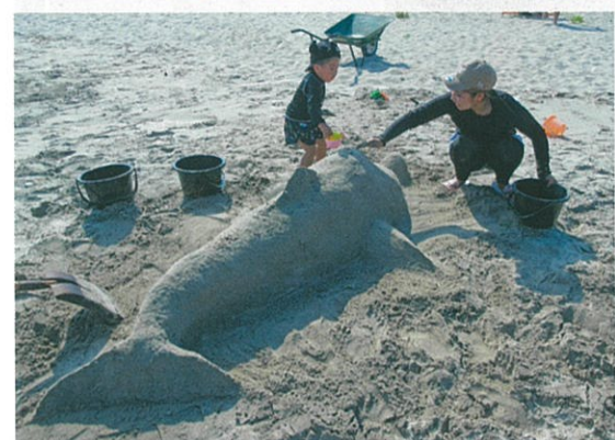
サンドアート《グッドデザイン賞》