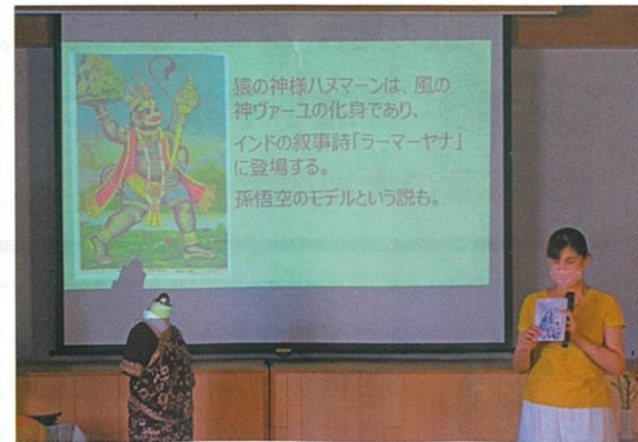
インド文化体験講座