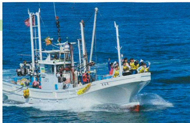
船上で大喜びの子どもたち