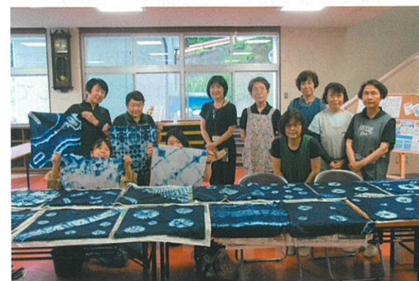
【生涯学習事業】 藍染め教室