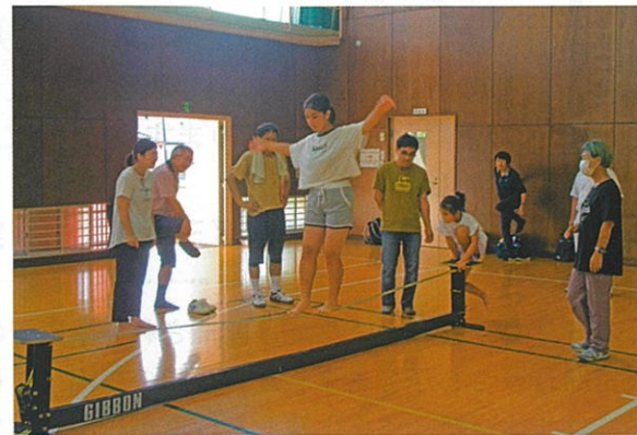
スラックライン教室